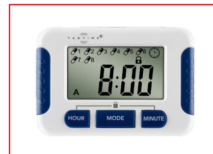
Dispositivo promemoria con allarme

Diversi studi scientifici hanno evidenziato che, dopo alcuni mesi dall'infarto del miocardio, circa la metà dei pazienti smette di seguire con regolarità la terapia raccomandata. Le cause sono la complessità del trattamento con elevato numero di farmaci da assumere quotidianamente o la presenza di più patologie, in particolare nei pazienti anziani.