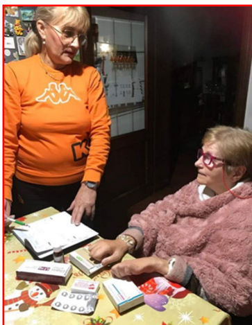
Il ruolo del caregiver

Certamente la popolazione anziana e/o affetta da disabilità è quella più a rischio sotto il profilo dell'aderenza alle terapie, specie in compresenza di più patologie. L'Italia è al primo posto in Europa per indice di vecchiaia, con intuibili conseguenze sull'assistenza sanitaria a causa del numero elevato dei malati cronici. L'aderenza alle terapie è pertanto fondamentale per la sostenibilità del SSN soprattutto in tempi di tagli alla sanità.